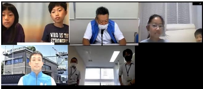
オンライン見学会の様子①