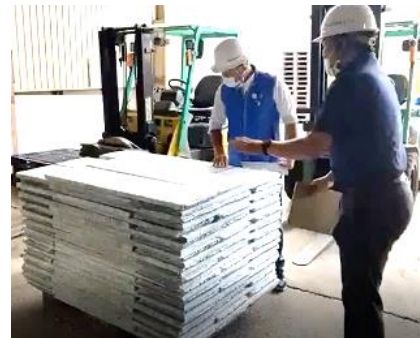
オンライン見学会の様子②