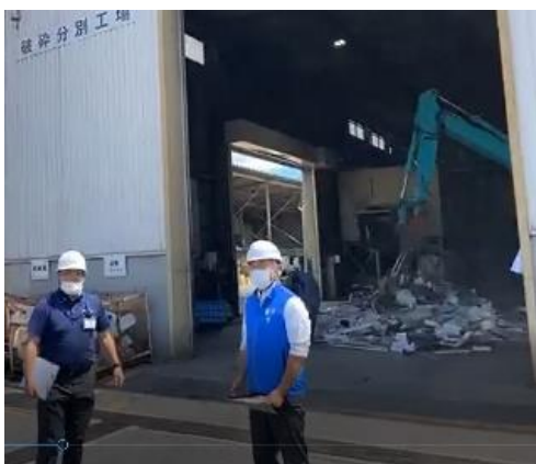
オンライン見学会の様子③