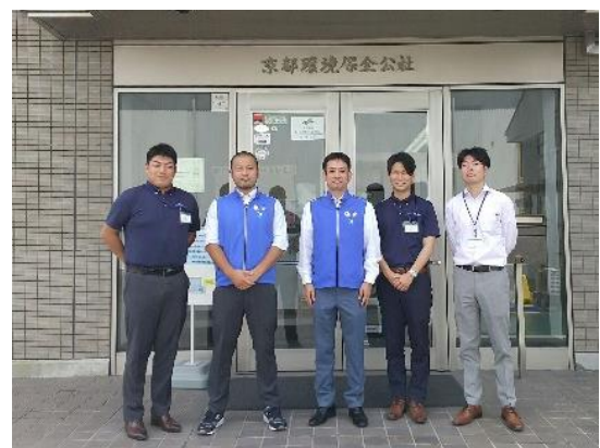
(株)京都環境保全公社にてご担当者様との集合写真